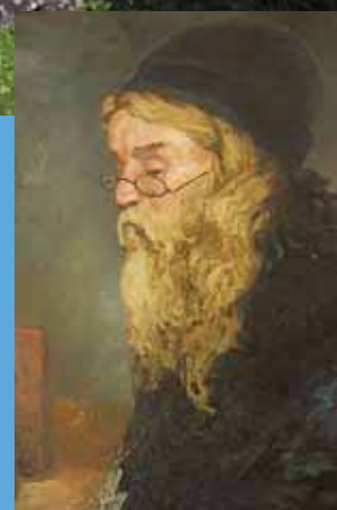
Преподобный Макарий (Глухарёв)

Разные силы, потребные для исполнения заповеди Христа Спасителя о проповедании Евангелия народам, в суеверии разных образов остающимся, рассеяны по разным членам Церкви... Между тем как одних посылают на проповедь, другие пекутся о воспитании, образовании проповедников; а иные собирают по всему пространству церковному, слагают воедино, сохраняют, приводят в движение многоразличные способы к поддержанию миссий и учреждению новых. Верные, составляющие Российскую Церковь, одни угождают Богу в благословенном супружестве, а другие приносят Ему девство и вдовство свое в благоприятную жертву... Во всех сих разрядах Церковь имеет силы благопотребные для составления миссий.