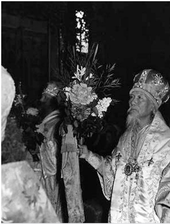
Епископ Пекинский Василий (Шуан) после хиротонии 30 мая 1957 года.

Однако позиция епископа Симеона, фактически способствовавшего разделению клира на два соперничающих лагеря, помешала созванию этого Собора.